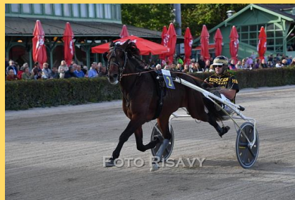
Hochüberlegener erster Zucht-Rennerfolg von Shining Star im „Badener Zukunfts-Preis“ der mit Hubert Brandstätter um den Sieg nie zu gefährden war